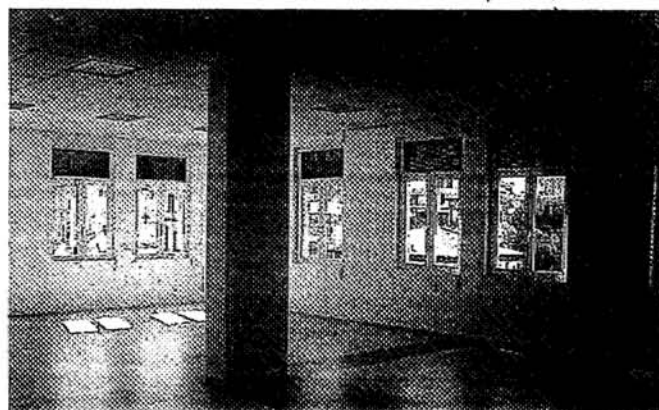
La palestra al secondo piano

conducibilità termica. Inoltre i nuovi ambienti sono rispondenti alle attuali norme acustiche. «Tutti questi interventi - termina Donati - sono stati realizzati tramite